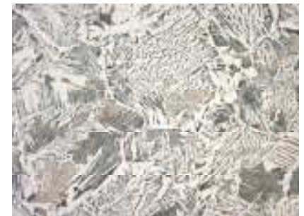
Schweißgut niedrig legiert